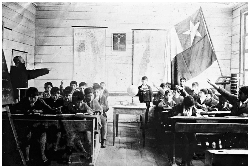
Figura 4. Lección en una escuela misionera capuchina, presumiblemente en Pelchuquín, actual comuna de Mariquina (según Flores y Azócar, 2015), s. f. Colección Universidad Católica Eichstätt-Ingolstadt, caja 01, n.º VA15_K01_017.

Efectivamente, en la Araucanía se llevó a cabo una notoria planificación territorializada y acompañada de una fuerte presencia misionera católica 11 , que actuó como cabecera de playa de una lenta penetración desde las dos zonas fronterizas a áreas rurales con presencia mapuche (Llancavil y González, 2017) 12 . Como se describe, los franciscanos administraron la parte norte del sector, recientemente anexada por intervención militar (1860-1883). Los capuchinos italianos, en tanto, se encargaron de la sección sur de la Araucanía y de los territorios de la provincia de Valdivia, donde se habían instalado entre 1848 y 1895 (Reschio, 2018) –en 1896 fueron sustituidos por capuchinos alemanes, que prolongaron y ampliaron la labor evangelizadora y chilenezadora (fig. 4) hacia el interior de la parte norte de la mencionada zona (Flores y Azócar, 2015; Llancavil y González, 2017; Mansilla, 2020)–.