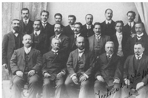
Figura 2. Profesores de la Escuela Normal de Victoria, provincia de Malleco, 1910. Museo de la Educación Gabriela Mistral, Archivo Fotográfico, n.º inv. FD-01752.

Ese desinterés de la élite se expresó asimismo en los recursos destinados a la instrucción primaria: del magro 3,6% del presupuesto nacional reservado en la década de 1850 a educación, poco más de un tercio fue asignado a aquella (Egaña, 2000). La apatía inicial dio paso a un segundo momento marcado por una planificación estructural del sistema educativo, para cuyo alcance y desarrollo el Estado inició un nuevo período caracterizado por un mayor compromiso y responsabilidad fiscal a partir de la Ley de Instrucción Primaria en la década de 1860. Luego de la guerra del salitre o del Pacífico, los fondos destinados a la instrucción pública aumentaron sostenidamente, creciendo la inversión de un 5,4% a un 14,2% del total del erario nacional entre 1882 y 1930 –una diferencia significativa con los períodos anteriores (Serrano, Ponce de León y Rengifo, 2012)–. La dotación de una estructura centralizada y acorde con el proyecto político de la élite controló la actividad