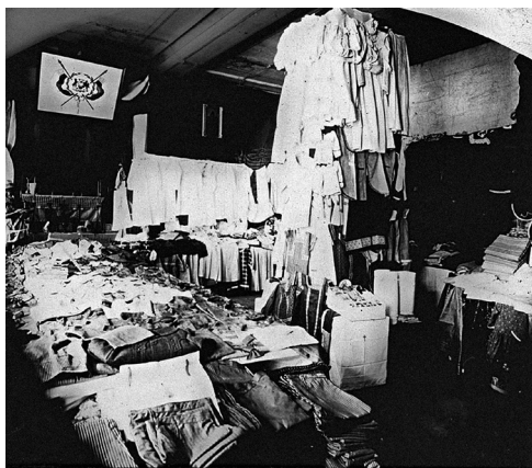
Figura 8. Exhibición de ropa para niños mapuche en escuelas e internados misionales, s. f.

Bañados dispuso que la actividad fuese obligatoria, se realizara durante dos horas semanales e incluyera tanto movimientos elementales del manejo de armas de infantería como incentivos para aquellos liceos o escuelas que los practicaran. Los profesores y preceptores los ejecutaban, y el visitador de escuelas los supervisaba, dando cuenta de las irregularidades al inspector general de Instrucción Primaria. Se demostraban así los atributos del Estado sobre los individuos y su dominación sobre los cuerpos de niños que, más tarde, prestarían servicios a la guardia nacional —y, en consecuencia, a la sociedad chilena— (ARA, FIC, vol. 145, fs. 11-12). De esta forma, los decretos emanados del nivel central orientaron la acción pedagógica, dejando muy claro sus propósitos al señalar que «la enseñanza elemental de los ejercicios militares de los internados i escuelas primarias para hombres es conveniente como preparación para el servicio de la guardia nacional» (ARA, FIC, vol. 145, fs. 11-12). En el