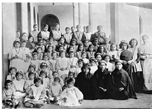
Figura 1. Niñas en la Escuela de la Providencia de Temuco, c. 1900.

Como hipótesis argumental se plantea que la instrucción primaria desarrollada durante la última década del siglo XIX en Ngulumapu fue parte de un complejo despliegue de control centralizado y altamente burocratizado, ejercido por funcionarios e instituciones educativas que contribuyeron a la construcción del proyecto nacional republicano y que actuaron como un dispositivo de disciplinamiento de la infancia mapuche . Para el desarrollo de este supuesto se han revisado datos y registros de las acciones educativas almacenados en el Fondo de Intendencia de Cautín (FIC), material que permite explicar cómo se normalizó la estadía de niños y niñas mapuche al interior del espacio denominado «escuela» (fig. 1). Específicamente, se consultaron