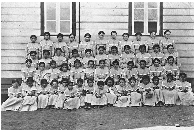
Figura 5. Niñas mapuche en una escuela de Bajo Imperial, s. f.