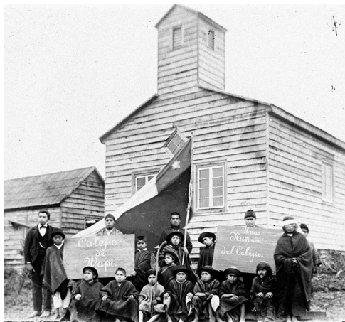
Figura 7. Niños del Colegio de Wapi (isla Huapi), lago Budi, hacia 1900. Colección Universidad Católica Eichstätt-Ingolstadt, caja 05, n.º VA15_K05_075.